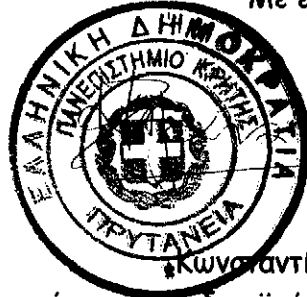
Κωνσταντίνος Τζανάκης Αντιπρύτανης Ακαδημαϊκών Υποθέσεων και Προσωπικού